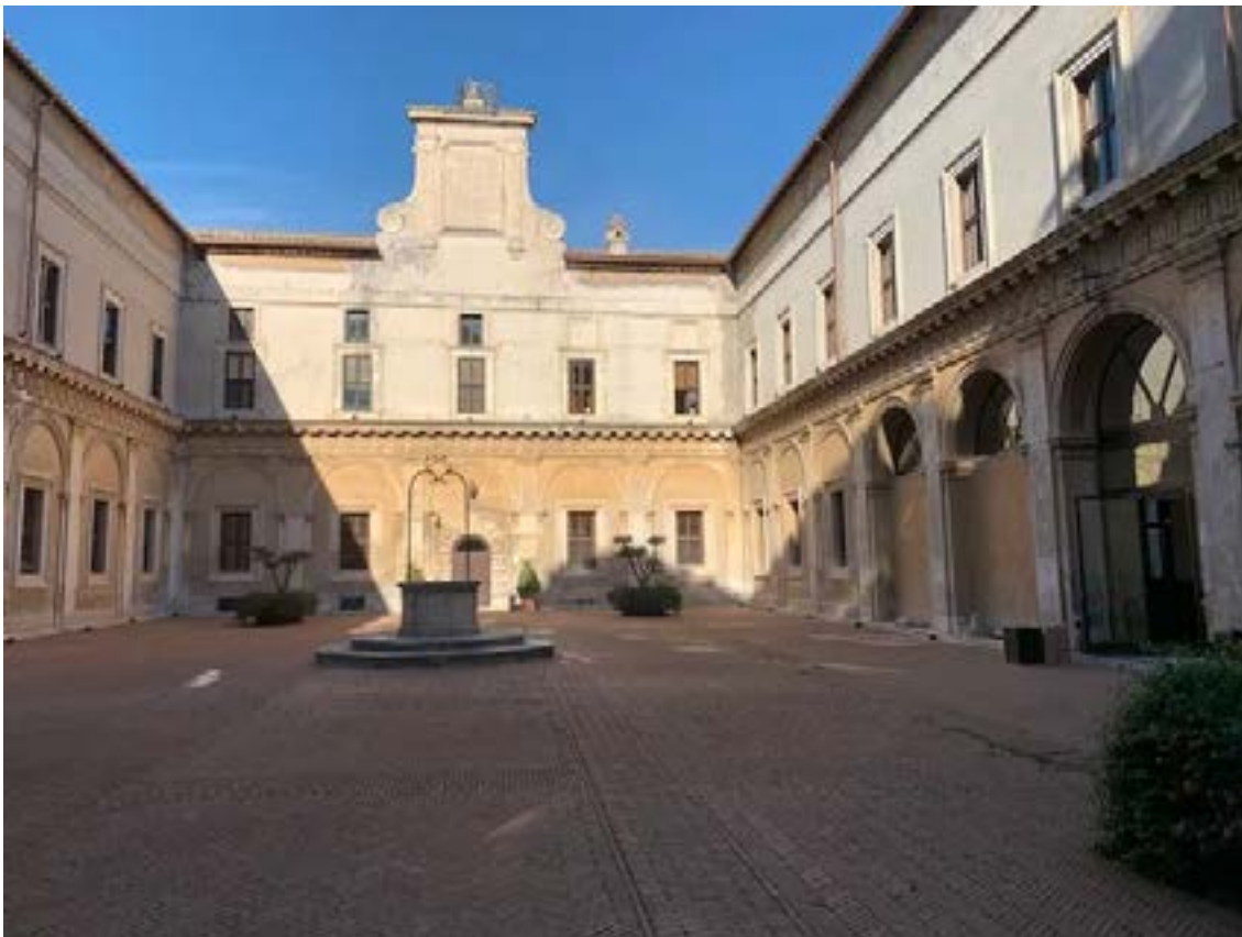
Το προαύλιο του Link Campus University

Η τρίτη ημέρα του Συνεδρίου ξεκίνησε με κεντρικό ομιλητή τον συνεργάτη του Συμβουλίου της Ευρώπης και του Ευρωπαϊκού Κέντρου Wergeland, Δρ. Άγγελο Βαλλιανάτο και θέμα «Η Θρησκευτική Εκπαίδευση ως παράγοντας της δημοκρατικής σχολικής ζωής» (Religious Education as a factor of democratic school life), ενώ στη συνέχεια ακολούθησε ο δεύτερος κύκλος εργαστηρίων. Μετά το μεσημεριανό γεύμα, οι σύνεδροι επισκέφθηκαν το Ιησουιτικό Κέντρο της Ρώμης και η ημέρα έκλεισε με την παράθεση επίσημου δείπνου στον προαύλιο χώρο του Link Campus University.