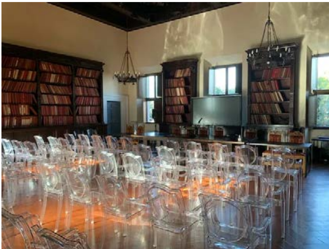
Η κεντρική αίθουσα του Συνεδρίου