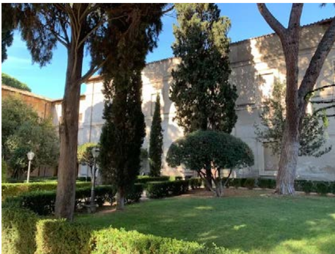
Άποψη από τους υπαίθριους χώρους του Link Campus University